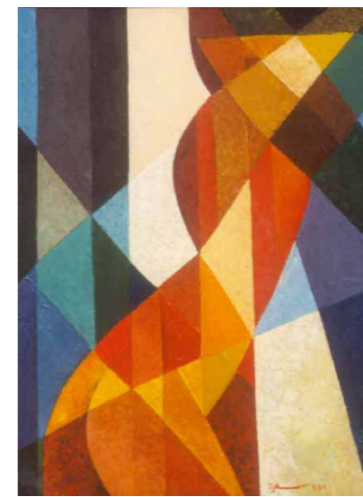
Кокетливая женщина. 1998

Спокойные виды любимых гор, освещенные мягко и рассеянно; островерхие крыши домов под блекло-голубым небом