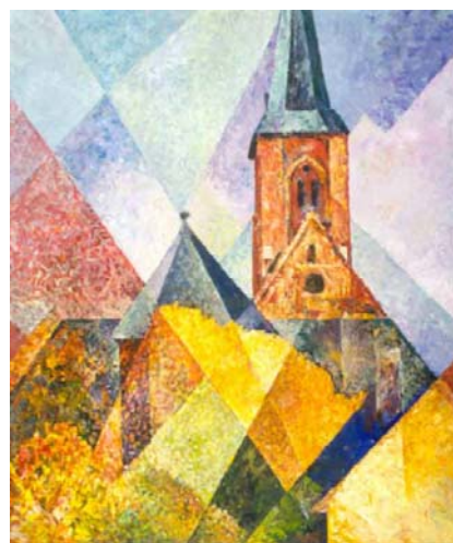
Эмир два. 1995 Кирха