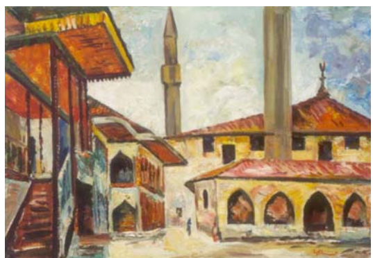
Старик с арбой. 1997 Мечеть в Бахчисарае. 2000