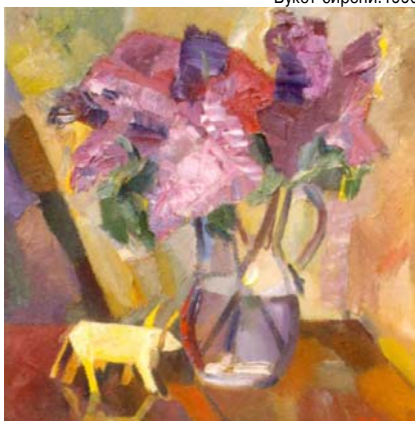
Букет сирени. 1990