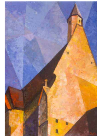
Собор под Веной. 1997